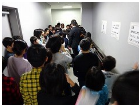
廊下で順番を待つ緊張の様子