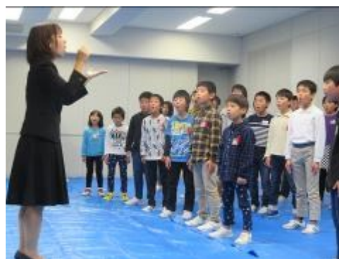
直前のリハーサルの様子