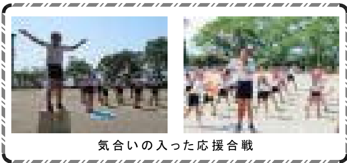
気合いの入った応援合戦

5月26日(土)は、好天に恵まれ、運動会を実施しました。 子どもたちは、最後まで諦めず、『力いっぱい 精いっぱい』がんばりました。 結果は、赤組の優勝でしたが、赤230点、白222点の大接戦でした。 当日は、多数の保護者の皆様、地域の皆様、来賓の皆様においでいただき、ご声援をいただきました。また、競技にも参加していただきました。ありがとうございました。