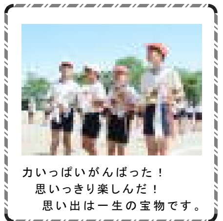
力いっぱいがんばった！ 思いっきり楽しんだ！ 思い出は一生の宝物です。