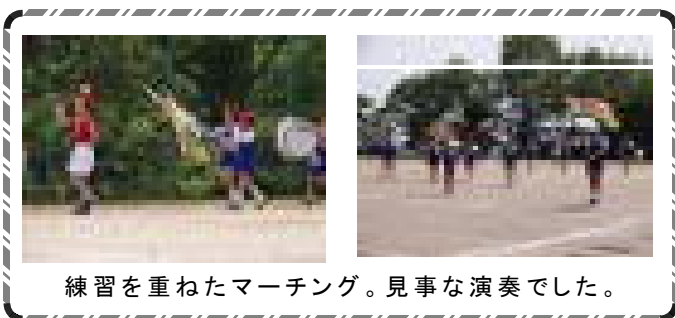
練習を重ねたマーチング。見事な演奏でした。