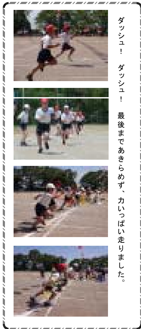
ダッシュ！ ダッシュ！ 最後まであきらめず、力いっぱい走りました。