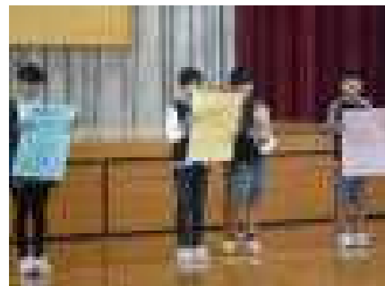
図書委員会の発表