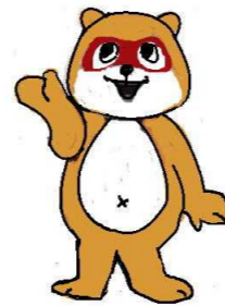
公認キャラクター 「ぜんたっつー」