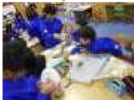
図書室でのゲーム

11月に読書旬間を行いました。低・中・高学年に分かれての読み聞かせや図書委員会の企画したゲーム、などが行われました。本に親しむことは大切なことです。これからも読書習慣を身に付けてほしいです。学校の図書室は12/25日～28日、1/4日・5日の9時から16時まで開いています。ご利用の際は職員室にお声かけください。