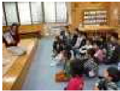
先生の読み聞かせ