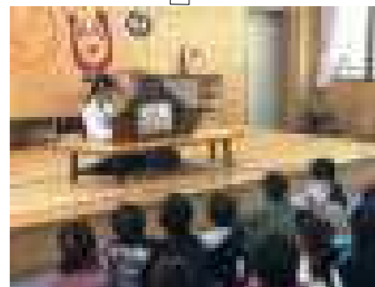
図書室での紙芝居